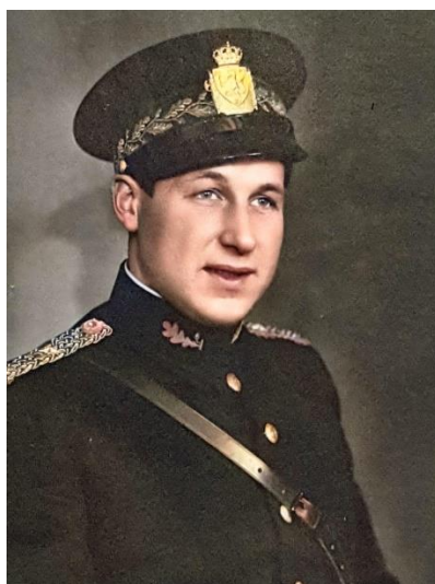
- og etter digital fargelegging