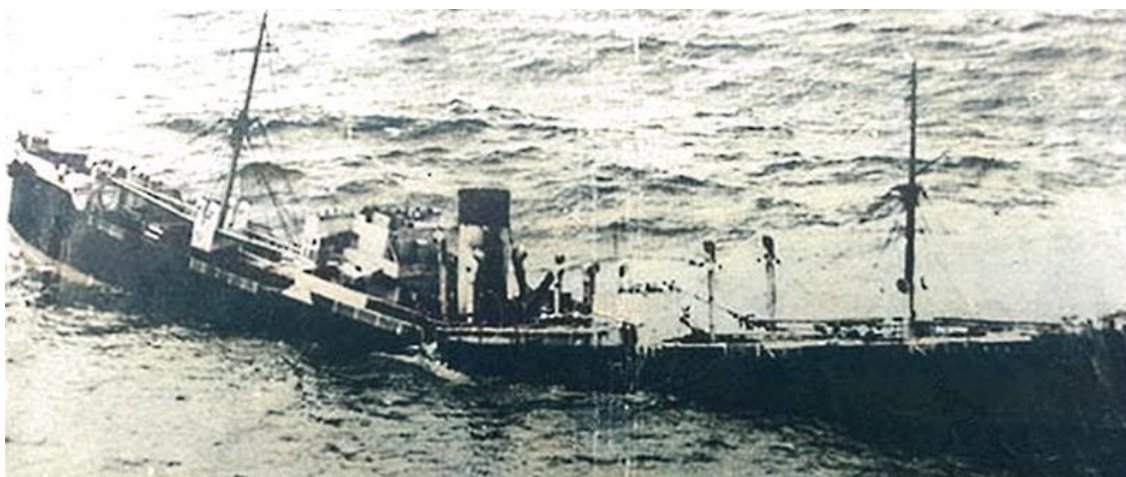
MS "Rio de Janeiro" synker etter torpedering.

Spesielt interessant er det at vi har fått et hittil ukjent bilde av det torpederte skipet til årets utstilling: