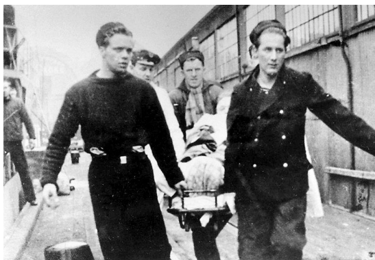
Originalt bilde fra boken