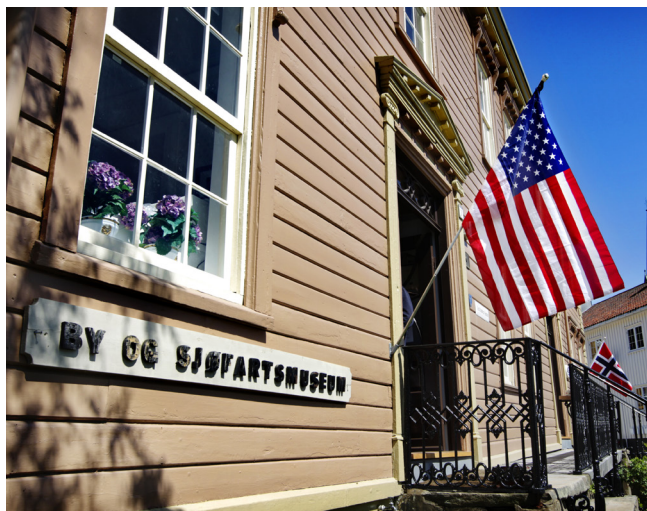
I 2012 preget utstillingen «Junaiten i Lillesand» By- og sjøfartsmuseet i Lillesand.