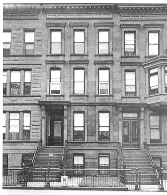
I 1930 hadde hun flyttet til 322 Macdonough Street.