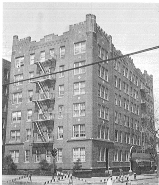
I 1926 bodde hun på 1141 Bergen Street.