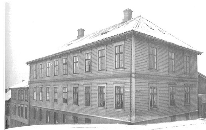
Waisenhuset-bygningene i Stavanger huset folksomme sovesaler. Eksterior og interior fra Waisenhuset cirka 1910.