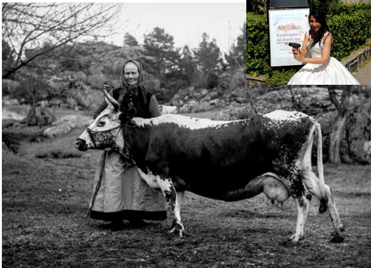
Foto fra utstillingen "Bonde og brud" av Andreas T. Mæbø, gjenskapt av fotograf Trygve E. Tønnesen

2015 har vært et vellykket og fredelig år med gode anmeldelser i aviser og på flere digitale plattformer. Utstillingstema "Bonde og brud" handlet om tidligere tiders kystkvinner og deres mangesysleri som både bonde, fisker og husmor. Mennene kunne være flere år til sjøs ad gangen, så kvinnene måtte ofte stå for det hele på hjemmefronten. Som en tributt til de tøffe kystkvinner, feiret vi dem i deres fineste stas med en særutstilling av rundt 30 brudekjoler fra en epoke på over 120 år. Dette var kjoler vi fikk låne av Lillesandsfolk, og ikke minst serien med kjoler fra andre verdenskrig gjorde inntrykk og passet til 70- og 75årsmarkeringen av 1940 og 1945. En praktkjole fikk vi tilsendt fra USA, etter en utflyttet Lillesandsfamilie.