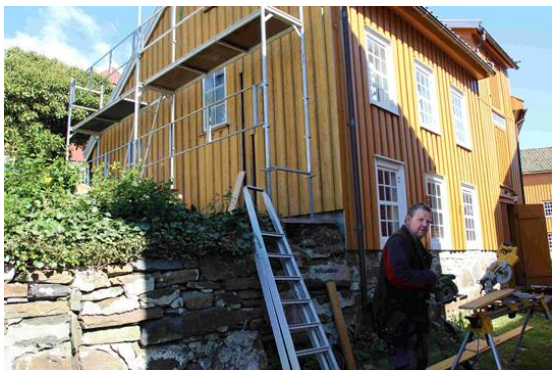
En vegg i bakgården ble malt.