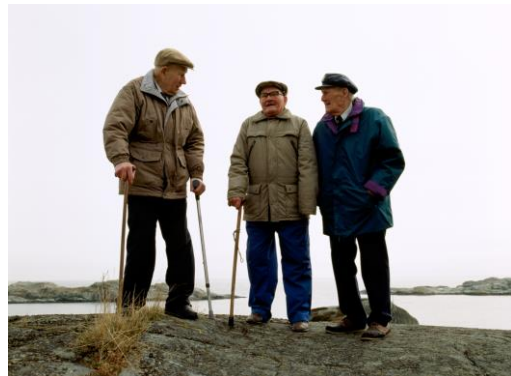
Tre av fiskerne på Ågerøya som opplevde torpederingen i 1940. Dette bildet er fra 2002.