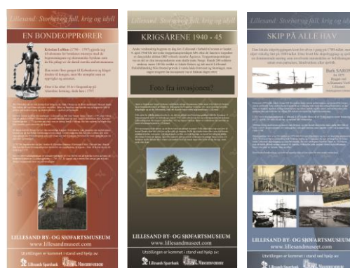
Noen av plansjene fra den historiske utstillingen på Tollboden, designet av Rita Strandmvr