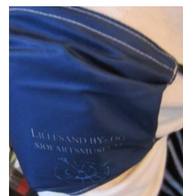
Museumsbutikken fikk laget egne masker med museets logo på!