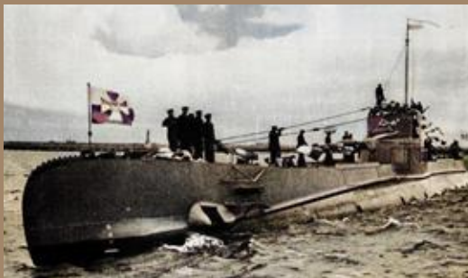
Den polske ubåten ORP «Orzel» som senket det tyske troppetransportskipet utenfor Lillesand 8.april 1940