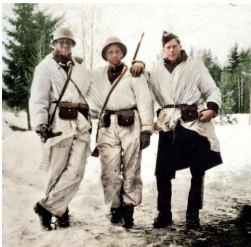
Fra Midtskogen 1940.