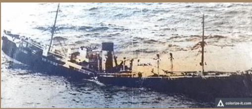
MS «Rio de Janeiro» synker etter å ha blitt torpedert

Hverdagsliv under krigen Lokale helter til sjøs og på land Tidligere krigshandlinger i Lillesand