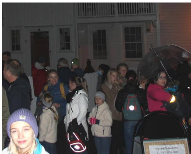
Til venstre bilde av kø foran museets sommerutstilling og over litt av køen på Kulturnatta