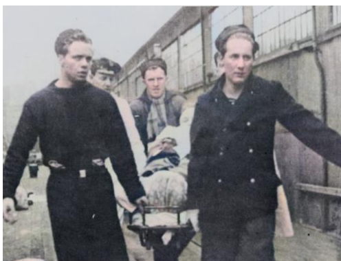
Tyske soldater bæres i land i Kristiansand.