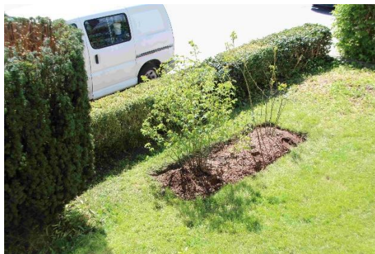
Forhaven luket og pleid av Ellen Barbakken.