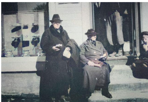
Venter på evakuering ved tidl. Baker Knudsen