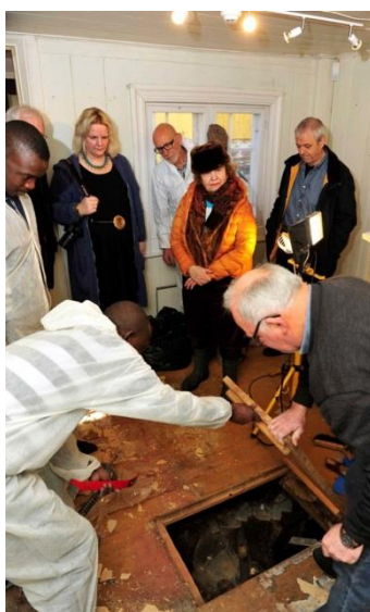
Brønnen