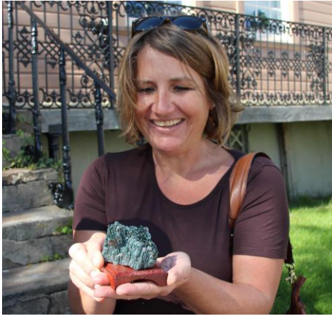
Gjest nr.5.000 på museet 2012 fikk en steinhilsen fra St.Gobain

Vi hadde i 2012 i alt 6.692 registrerte besøkende til omvisninger, skoleopplegg, foredrag og utstillinger ( i 2011 var tallet 5.308). Dertil hadde vi rundt 1600 besøkende til andre arrangementer, så som for eksempel julemarkedet og 17.mai-feiring med historiske leker i museumsbakgården, til sammen 8292 gjester. Dette er rekord i museets historie, og ganske suverene tall med tanke på byens størrelse og museets budsjett. Gjester til kunstutstillingene, Tollmuseet, Sjømannsforeningen og Museumsbutikken, samt de mange håndverkere som har vært aktive på museet er ikke regnet med.