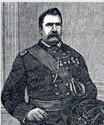
Soldat i Den amerikanske borgerkrig