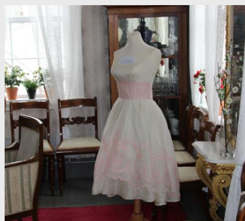
Kennedy-kjole fra sommerutstillingen