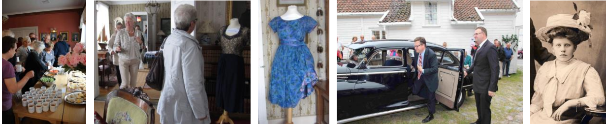
Fra åpningsfesten, den 18.juni 2012

Våre tre supre sommerguider fortjener også en takk, de stilte alle opp med entusiasme og suveren serviceinnstilling. Puh! Det er godt at det ikke er Oscarutdeling!!!