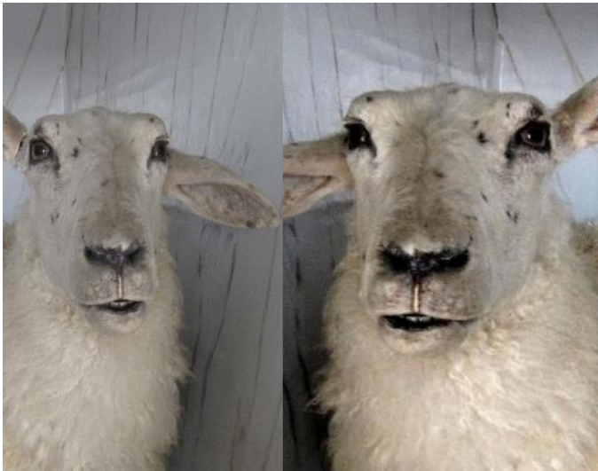
Museet har fått to sauer i sponsorgaver!

Særlig må likevel nevnes to utstoppede sauer som vi har innkjøpt med sponsormidler fra hhv Lillesand Elektro A/S og Carl Knudsen-Gaardens Venner. Disse har vi allerede hatt mye glede av, de brukes sommer som vinter til forskjellige utstillinger.