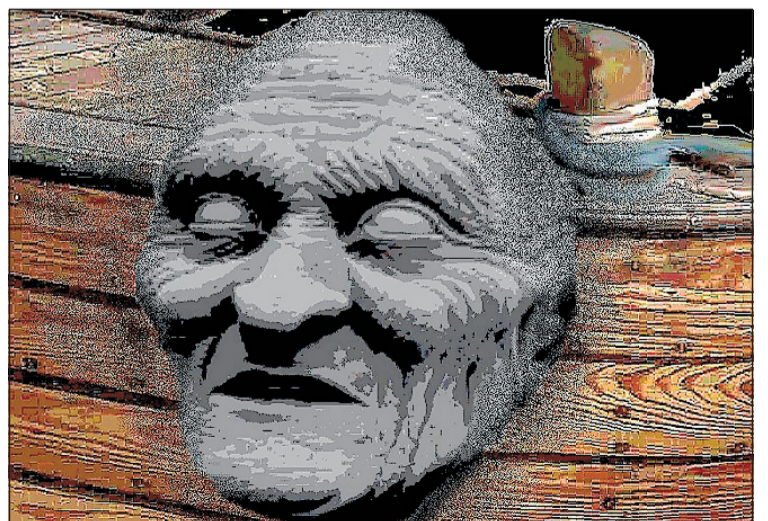
"IKKJE SKJYD!": Fotomanipulasjon av Anne Sophie Høegh-Omdal.