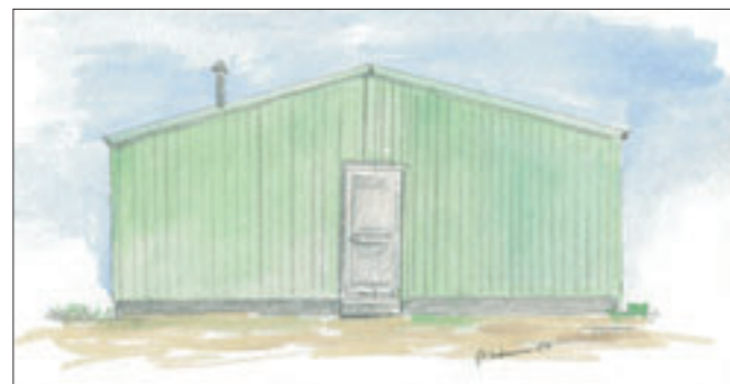
Brakke 5 x 8 meter

Brakkene bestod i hovedsak av 2 typer. Den ene var på 13,5 x 5,5 meter, og den andre var på 8 x 5 meter. Sistnevnte brakke kunne kobles sammen til et større bygg.