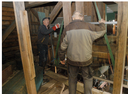
Ohoi! Det er så vidt det går, med en millimeters klaring lirkes glasset opp gjennom etasjene i uthusbygningen.