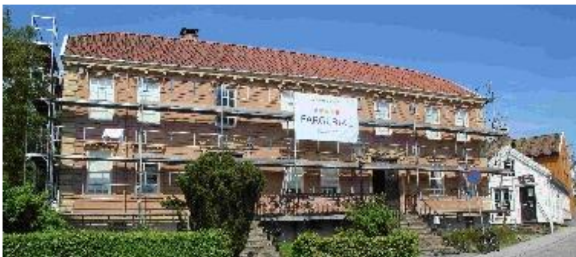
Museet males 2019, etter vedtak i Bystyret om fortsatt å beholde den omdiskuterte fargen.