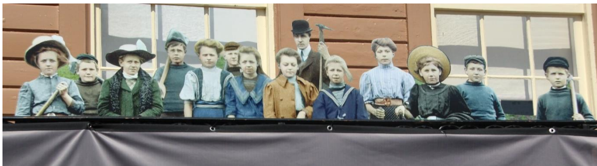
Skolebarn fra 1910, digitalt fargelagt, foran museet 2019