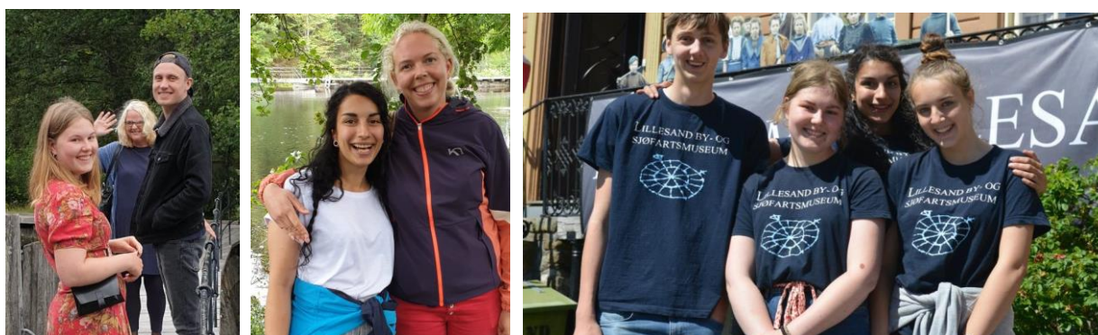
Noen av sommerguidene og ekstrahjelperne sommeren 2019.